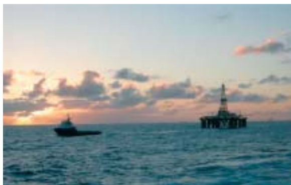
Sea Lynx sleper Sedco 704.

Etter styrets oppfatning gir det fremlagte årsregnskapet og balanse med tilhørende noter for morselskapet Deep Sea Supply ASA og konsernregnskapet, et rettviseende bilde og fyldestgjørende informasjon om selskapets og konsernets resultat og stilling ved årsskiftet.